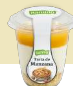
Galleta, Queso y Compota PSTMA