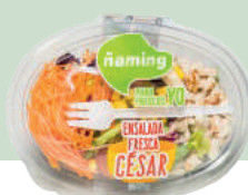
Ensalada César EFCE15