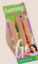
Pavo Ensalada Integral SBPA