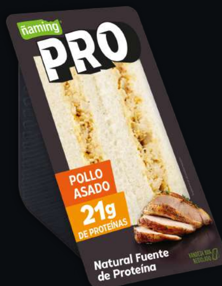
Pro Pollo Asado PROPO