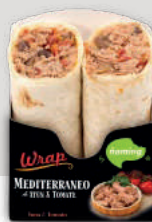
Mediterráneo de Atún WATU