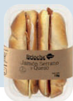
Jamón Serrano y Queso BRJ2