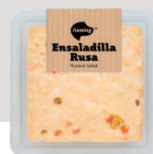
Ensaladilla Rusa ENRU