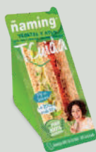
Vegetal y Atún V