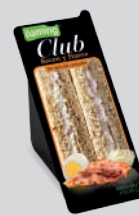
Bacon y Huevo PAN DE CEREALES CLBA