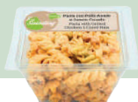
Pasta Jamón y Pollo Rusa ENPJ ER19