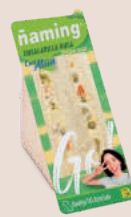
Ensaladilla Rusa ENSA