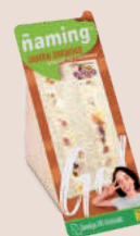
Jamón Cremoso JC