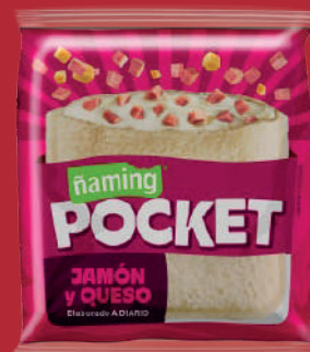
Jamón y Queso PKTMIX