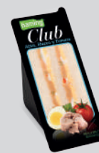
Atún y Huevo CLSATU