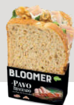
Pavo Braseado BOPB