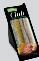
Tortilla de Patata TO