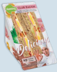
Club Bacon DECLU