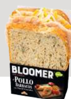
Pollo Asado BOPO