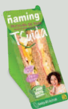
Pechuga de pavo PRI