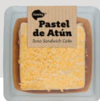
Pastel de Atún PSATU