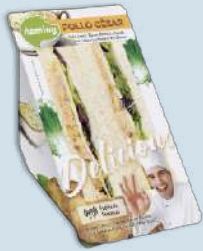
Pollo César DEPO