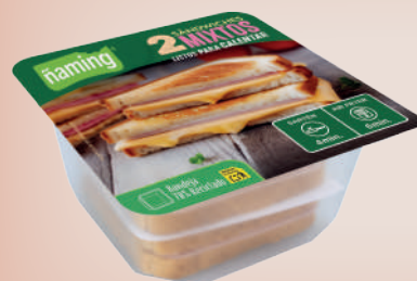
Brioche mixto doble divisible BRDM2