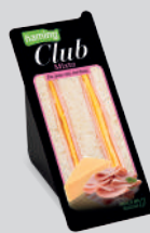
Mixto PAN SIN CORTEZA CLSMIX