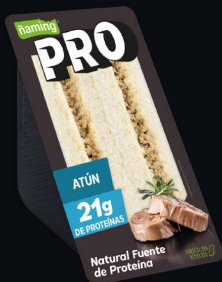
Pro Atún PROATU