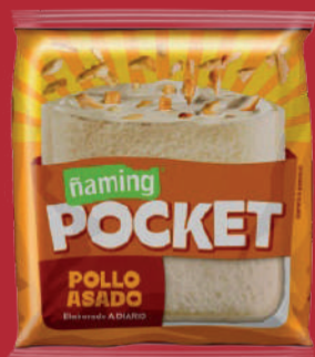
Pollo Asado PKTPO