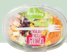
Ensalada Mixta EFMIX15