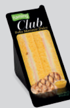
Pollo Mostaza-Dulce CLPO