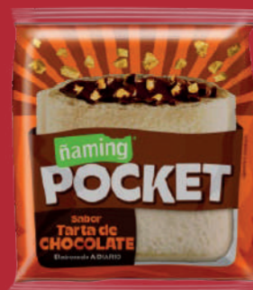
Tarta de Chocolate PKTTCH